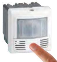
0 784 86