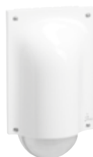
0 488 34 (IR érzékelés)