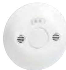
0 488 22 (Infravörös és ultrahangos érzékelés)

Érzékelő és vezérlő kiválasztási táblázat: 805. oldal Műszaki jellemzők: e-katalógusban