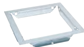
0 880 83