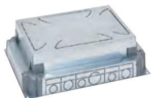
0 880 90