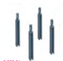
0 880 86

Megfelel az IEC/EN 60670-23 szabványnak.