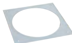
0 880 89