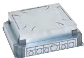
0 880 91