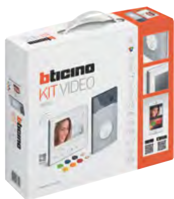
BT-3 639 11

2-vezetékes, okostelefonról vezérelhető videó kaputelefon szett, Wi-Fi csatlakozással