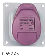
0 552 45