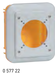
0 577 22