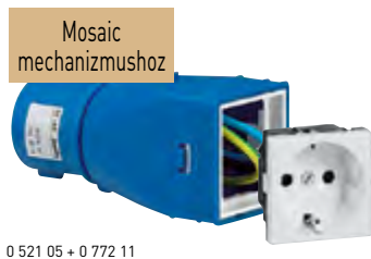
0 521 05 + 0 772 11