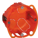
0 801 01