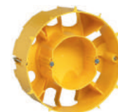
0 893 78