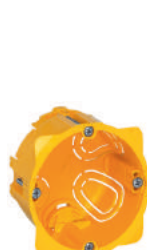
0 800 51