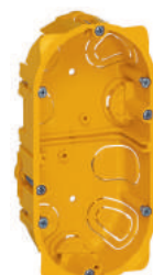
0 800 42