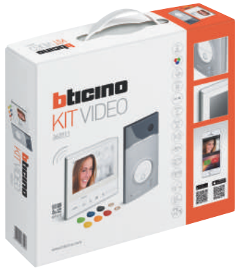
3 639 11