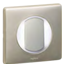
067001 + 067670 jelzőfény

Jelzőfények, ellenőrzőfények, kiegészítők